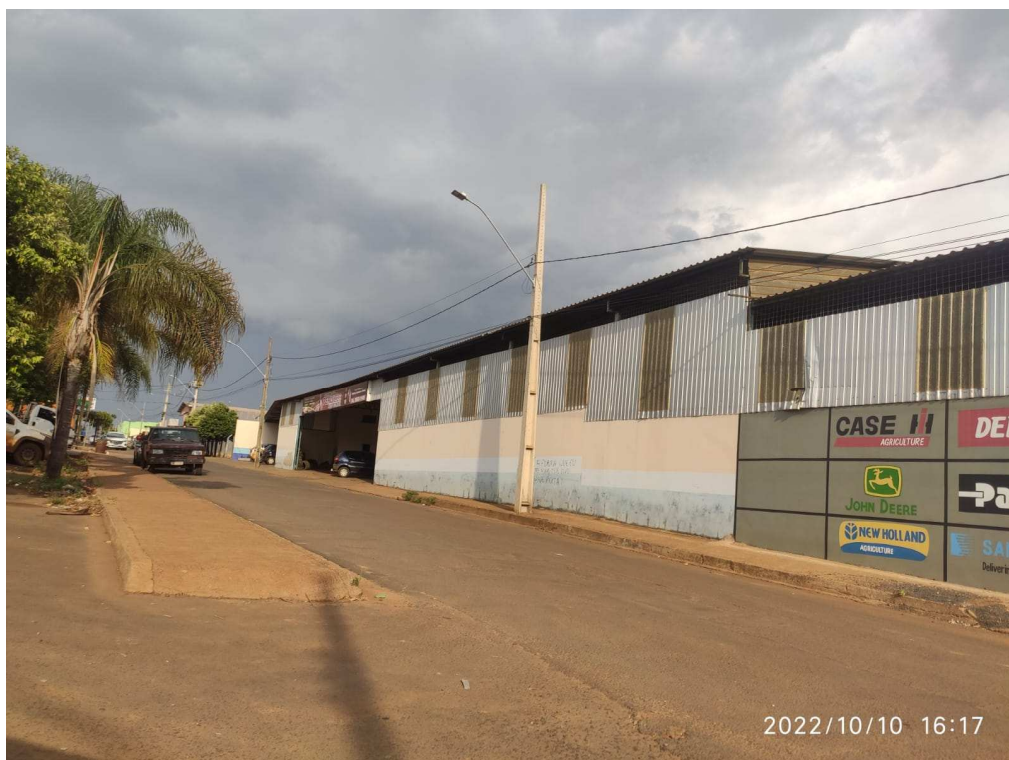
Rua Romeu Paulo de Castro