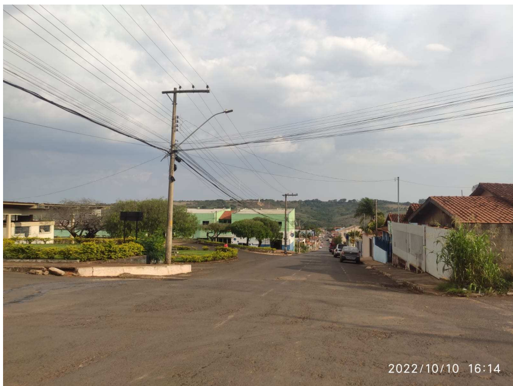
Rua João Luciano Barbosa