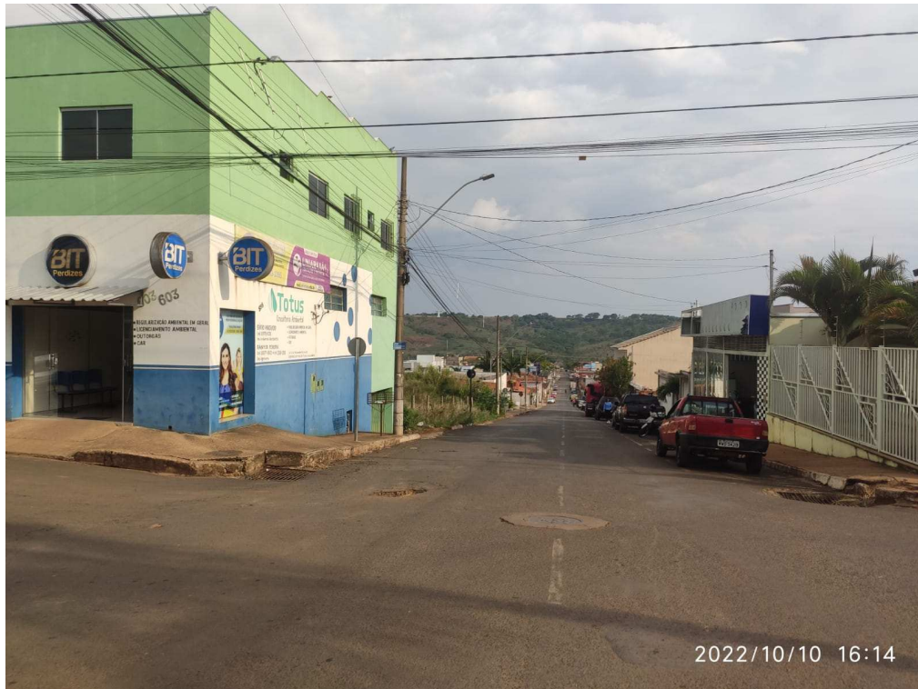
Rua João Luciano Barbosa