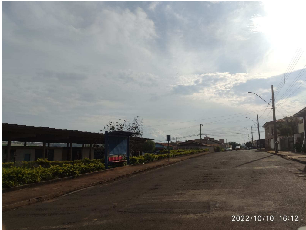
Rua Custódio José da Silva