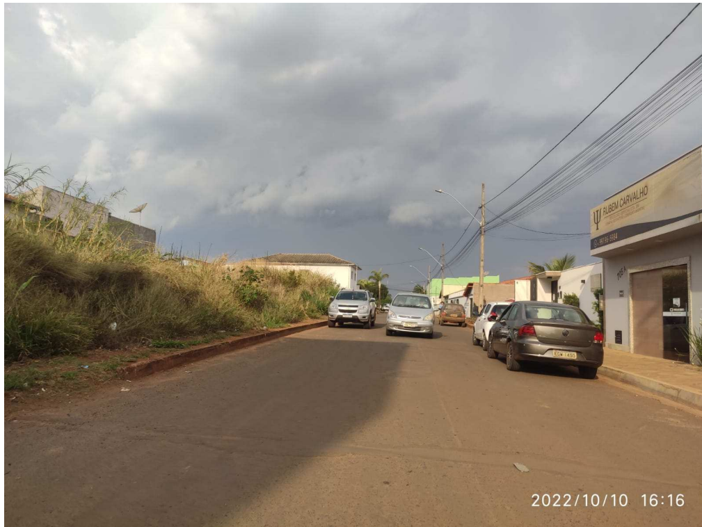
Rua Romeu Paulo de Castro