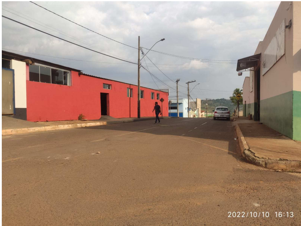
Rua João Luciano Barbosa