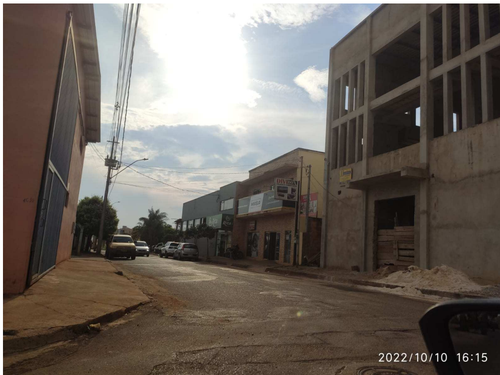
Rua Romeu Paulo de Castro